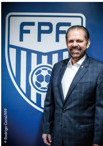
Reinaldo Carneiro Bastos, Presidente da FPF

Temos a incumbência de trabalhar, juntos e incessantemente, por uma gestão esportiva profissional, responsável e de alto nível, buscando oferecer aos nossos Clubes, atletas, funcionários e torcedores o melhor Futebol Paulista que pudermos, sendo que o Programa de Excelência é um vetor fundamental para esta evolução.